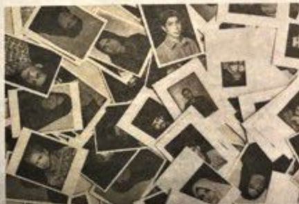
Neergeduwarreide portretten, onderdeel van de expo Het beeld hervonden.