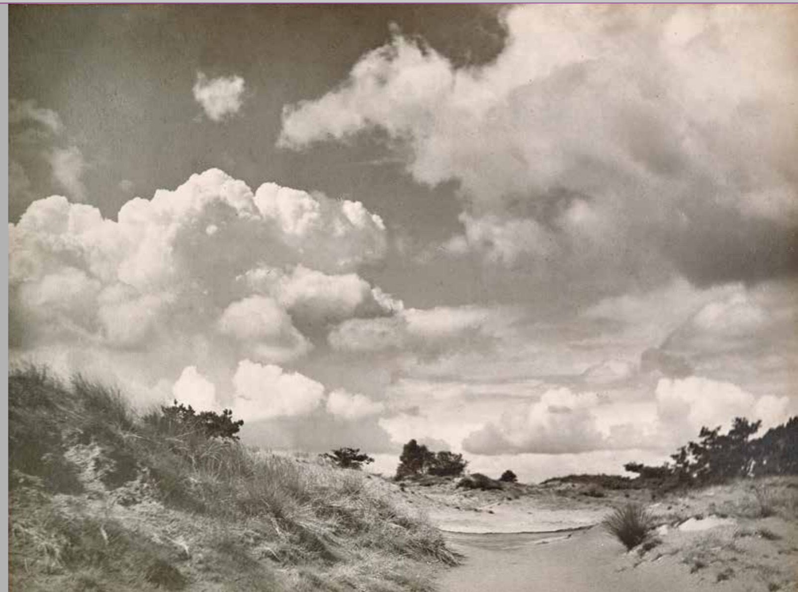
Dreigende lichten boven een stuiflandchap, omgeving Eindhoven, eind jaren dertig.