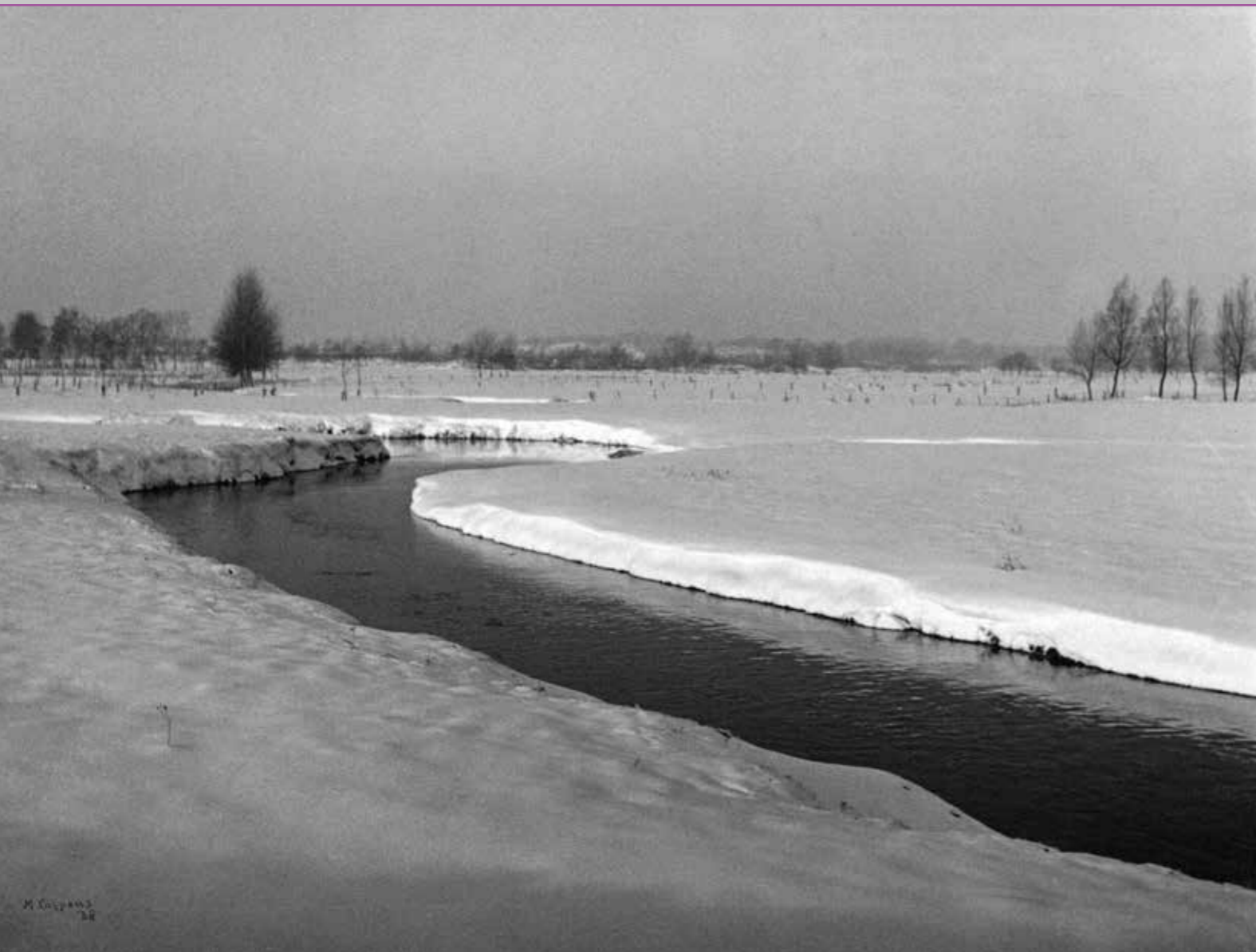
Winter in Opwetten, 1938.