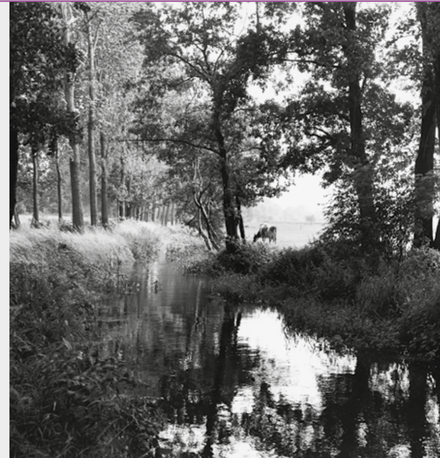
Foto boven: Best / Oirschot, 1991.

Ten slotte is er ook plaats voor humor, zoals te zien is aan de modderpoelen van Paul Bogaers (1961), waarbij je goed moet kijken waar de (foto van de) waterplas ophoudt en de rand van modder (papier-maché) begint. In de expositie over Het Groene Woud wordt de nadruk gelegd op mooie, poëtische beelden, maar er is ook ruimte voor een kritische noot. Weemoed en werkelijkheid, ernst en humor wisselen elkaar af. ■