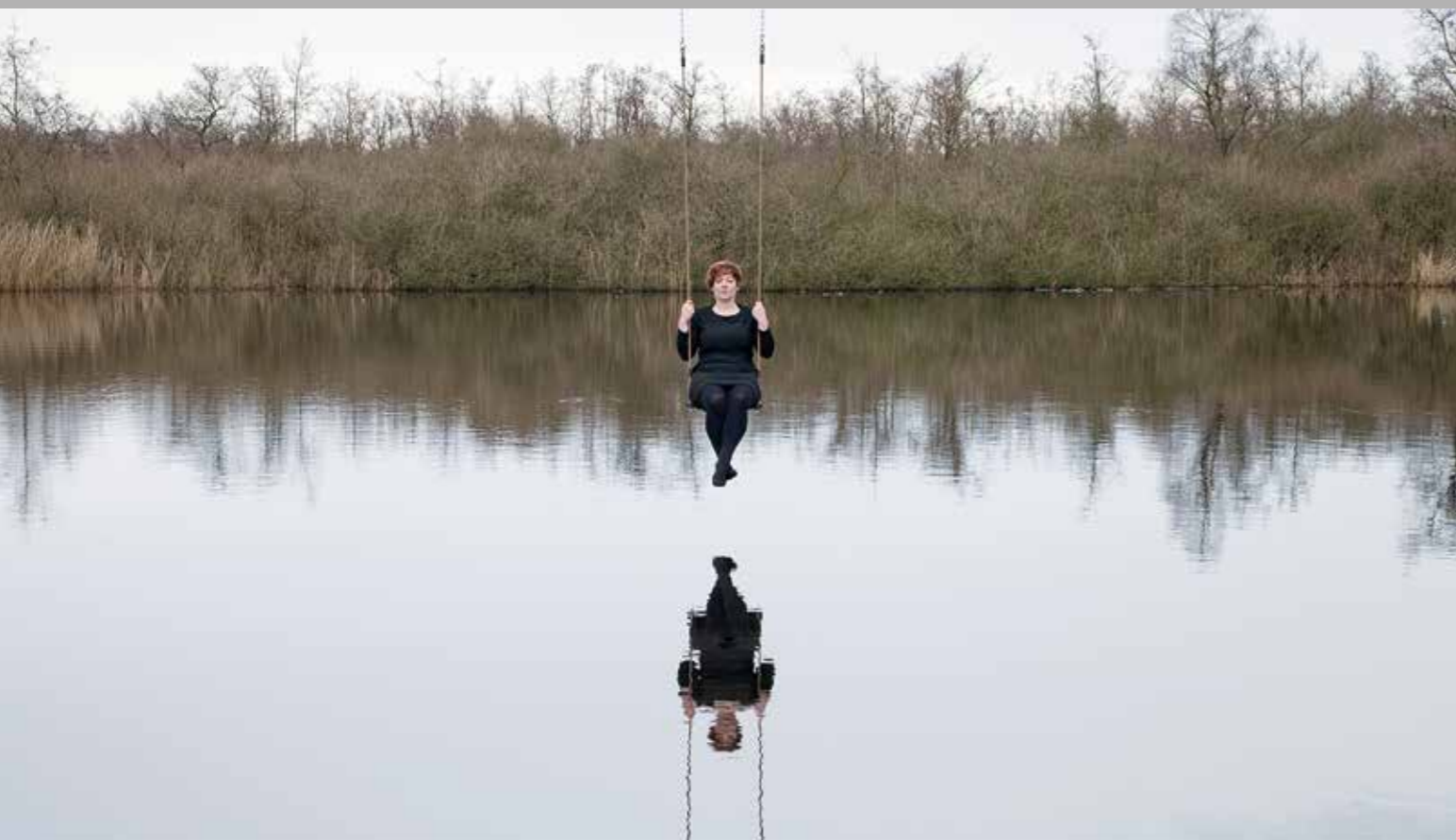
Heen en Weer, Moerputten, 2014. (Video-installatie: Noortje Haegens)