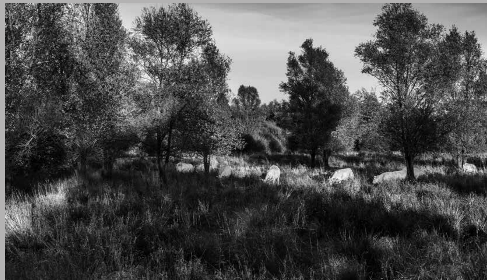
Reconstructie van de Beerze bij Oirschot, 1998.