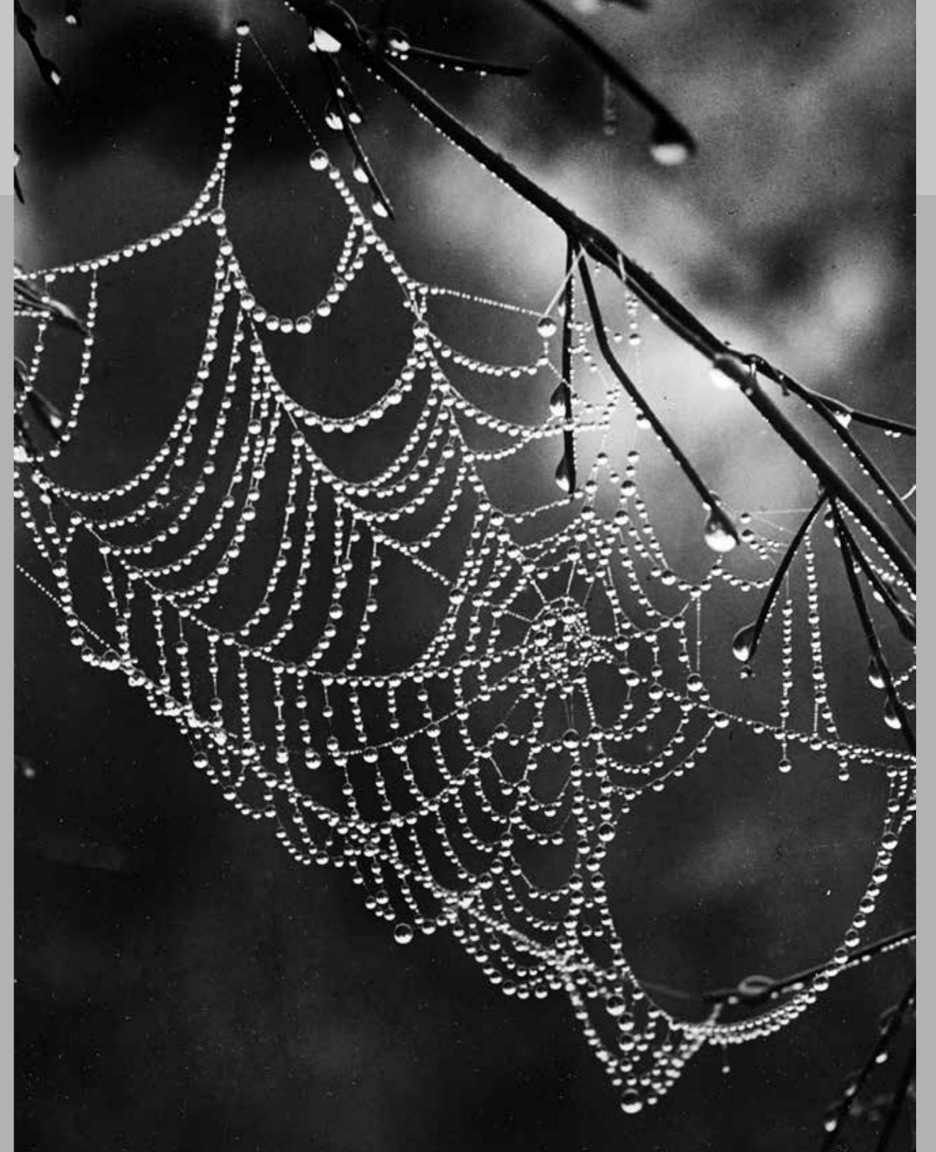
Foto links: Dauwdruppels aan een uitgebloeide dravikhalm, 1942.