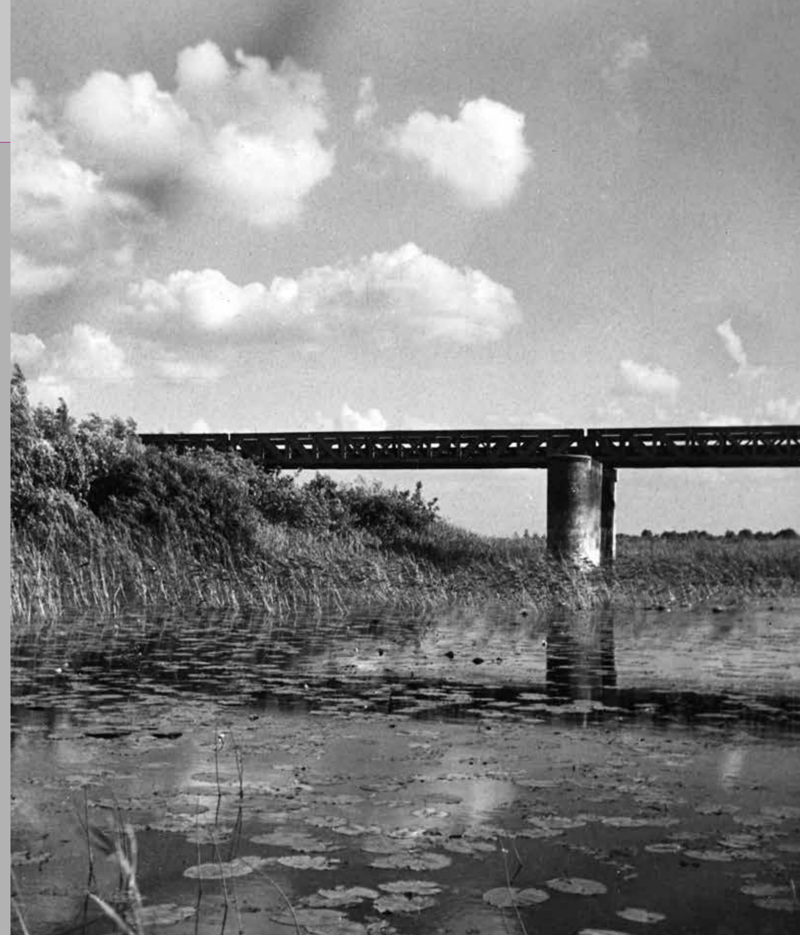
Foto rechts: De Moerputten bij Deuteren, jaren zestig.