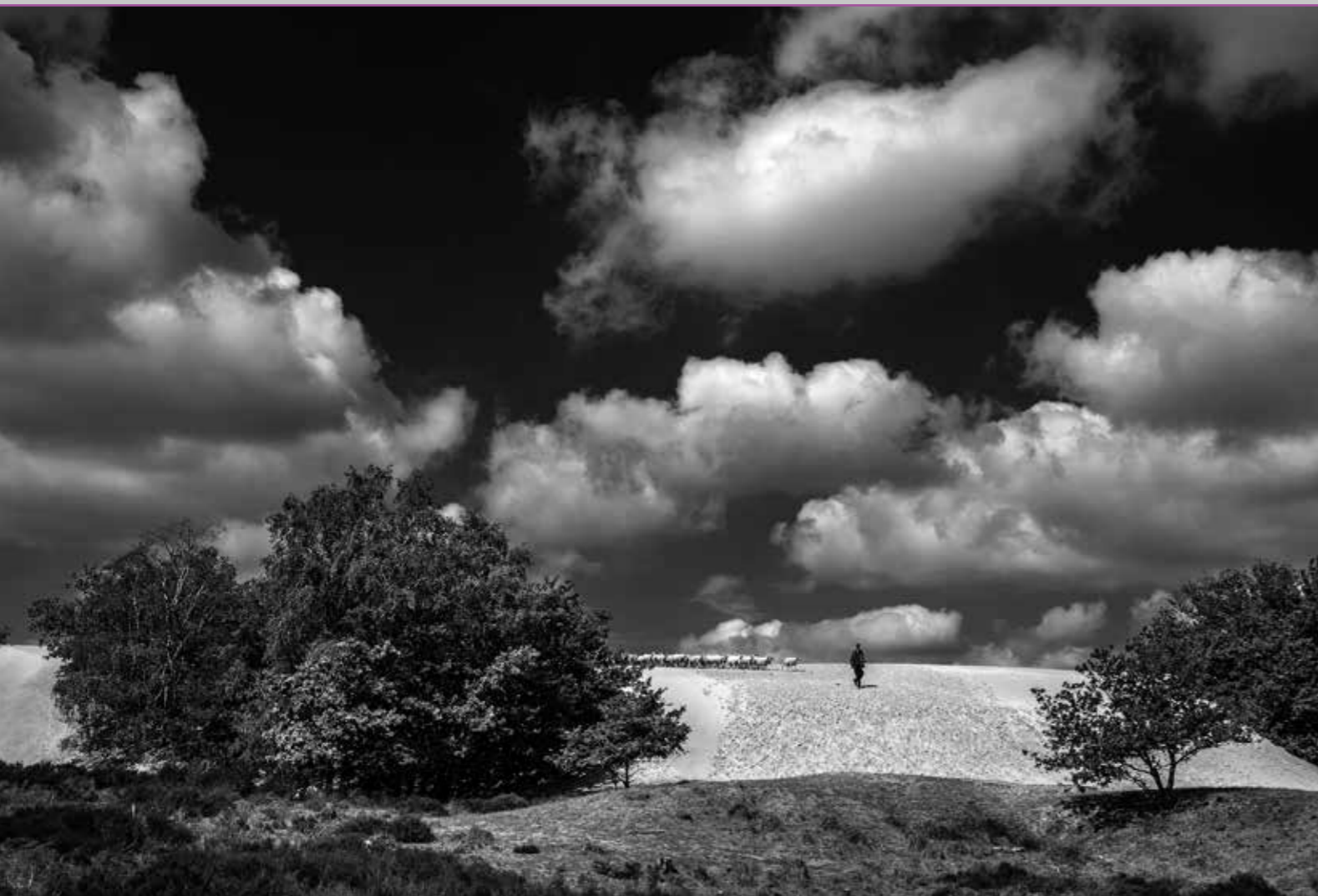
Schaapsherder, Udenhout (Loonse en Drunense Duinen), juni 2019.