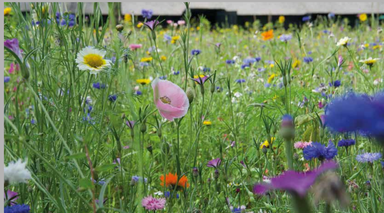
Het atelier van de kunstenaar op Landgoed Baest omringd door bloemenweiden, 16 juli 2019.