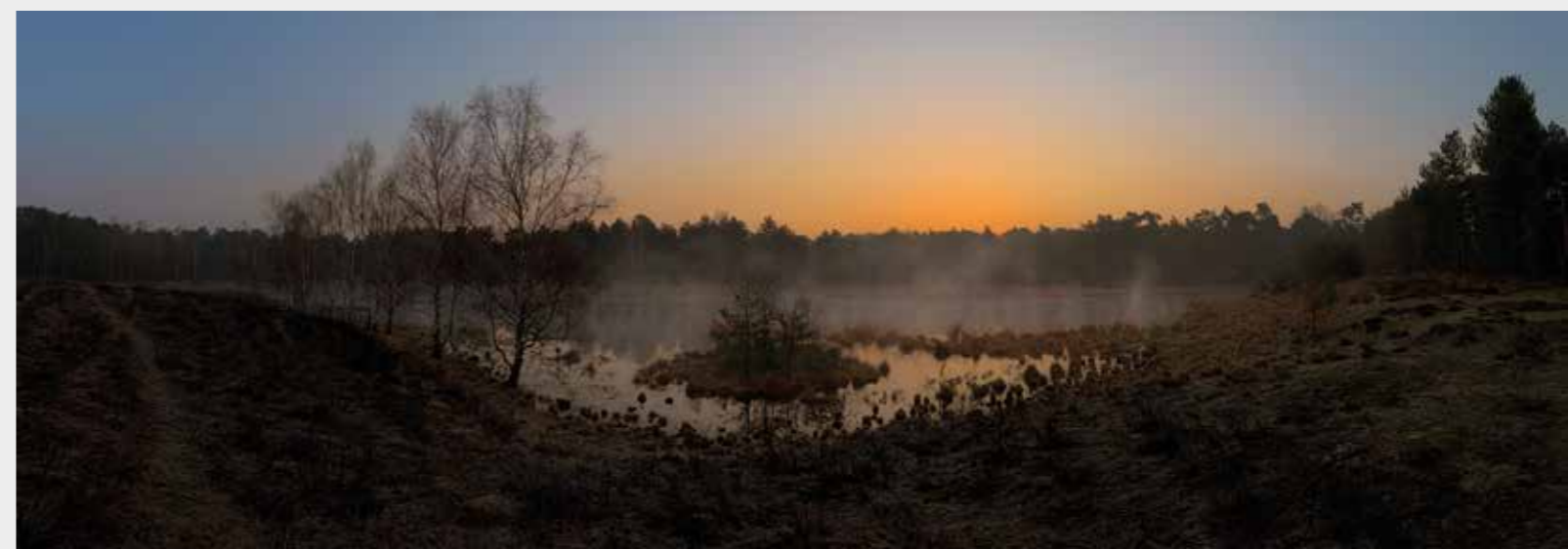
Foto onder: De ochtendzon over de net gebluste heidebrand bij Bosven op de Kampina, 2011.