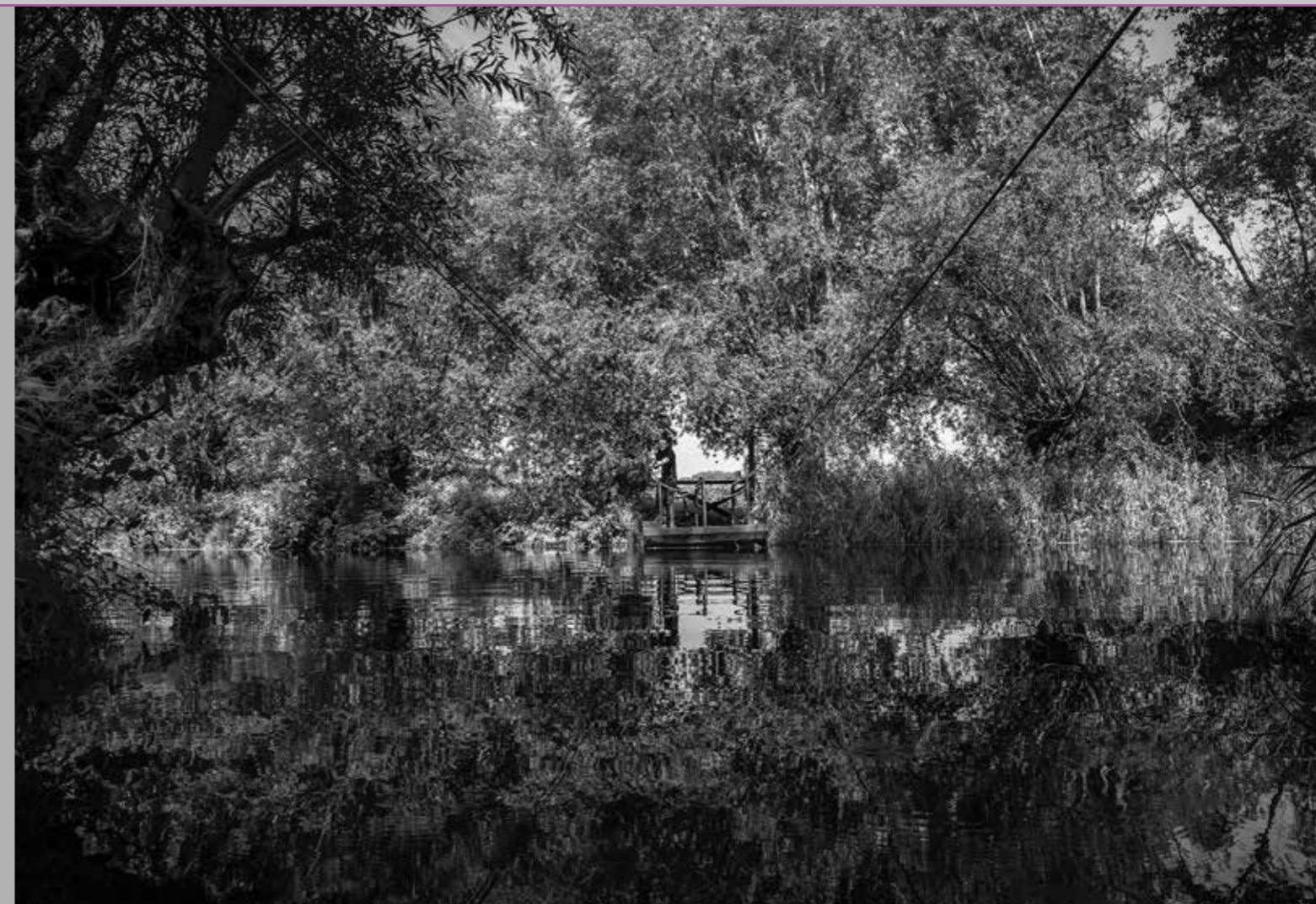
Sint-Janspontje, Liempde (Dommelsteegje), augustus 2019.